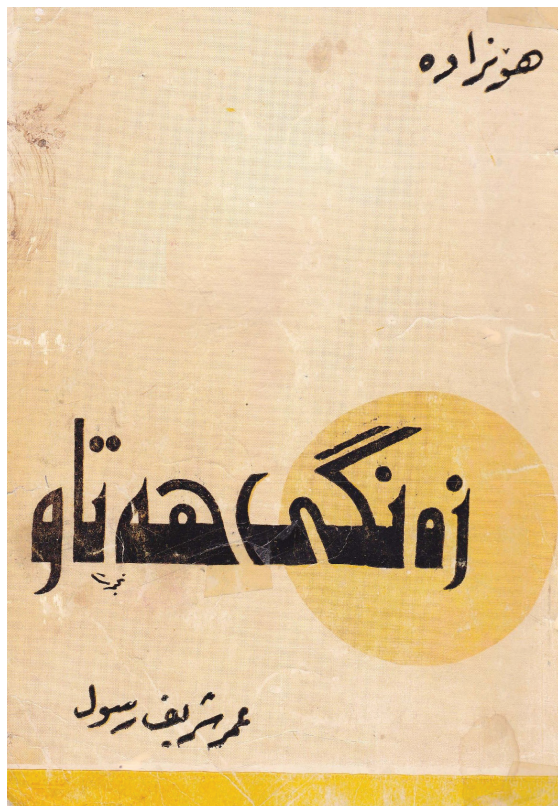
زەنگی هه تاو عومەر شەریف ره سوول