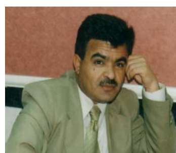
جه ميل سجاوى