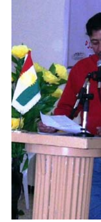
زوراب مه خمووري

روژاني 17- 2008/3/18 سه نته ري روشنبري مه خموور يه که مين فيستيقي شيعر خويندنه وه ي بو شاعيران ( يوسسف