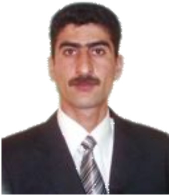
خه لیل پالادی

تا ئه دوو ساله (cpa) ئه مریکیه کان له مه خموور فهرانزه وایه تی ئه و ده فهرانه یان ده کرد، ریگایان نه ده دا ئالای کوردستان به تنه یا له سه ر دام و ده زگا حکومیه کان و باره گای حیزنه کان هه لیکریت، ده بو له ته کیدا به خو شی بیته یا به ترشی ئالای به عسیان هه لکرده، ئه گینا ده بو ئالای کوردستان بیته خواره وه، خو هه ندیک له لاینه کان خو یان به ر له وه هه لیانکرده بو، له دانیه شته کانیشیانا له گه ل جه ماوه ئه م کاره یان به شتیکی ئاسایی هه ژمار ده کرد .