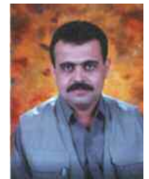
بهرپرسی روئشنبیری و هونهری مهخموور، بهمهش ههقالاتمان توانیان کاریگهری زۆریان ههپیت له پا کوردنهوهی شاری مهخموور له به عسی بهکان.

مهخموور ئه و شارۆچکه یه که ته مه نی قهزای له (۷۵) سهال زیاتره و بهرپه وهردی ههر سنی ناچه ی گوێرو دپه که و قهراجی له خو کورتوه و سههر بهپاریزگای ههولیره، خاوه نی دهشتئیکی کاسی سهکاسی بههپیت و فرهوانسی کشتوکالی و نههوتی. ههر له سههتاری دروست بوونی وه ک ئیداره ی قهزا له سالی (۱۹۷۷) وه تا کو ئهمرو، بهتایبهتیش سههتاری ههاتی به عسیه کان بو سههر دهسه لات بههوی سببسههتکانی بهعه ره ب کوردن، راگواستن و تالان کردن وای کردوه له پووی کۆمه لایه تی و ئابووری روئشنبیری و زیاری بهوه بهچی بهینی، بو ئهوه نه له شههتکان (حرس قومی) و عه شپاره ی سههتتری دهرووبهری