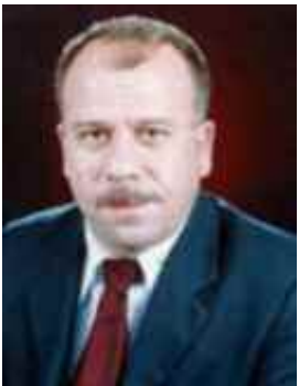
(ماموستا جه مال جه میل) بهرپرسی (سههتتری روئشنبیری و هونهری

سهرۆکی سهنهتري روئشنبیری مهخموور کهوت له وه لامی پرسساری ئایا دروست بوونی چه هند سهنهترو بنگه ی روئشنبیری له دواوی نارادیی ناوچه ی مهخموور و دهروبهری چی دهگه بهتی؟ وتی: دواي سهال له نارادیی مهخموور ناچه کانی دهروبهری سسی دامه زراوی بزوتنهوهی روئشنبیری و لهشارۆچکه ی مهخموور دامه زراوه ئهوانیش ههروو سهنهتري روئشنبیری مهخموور قهرهچووغ و بنگه ی روناکییری رۆژی سههر بهرئیکراوی دیاکۆنیای سوئیدییه بیگومان دامه زرانندی ئهم بنگه و سهنهتراهه ئهوه دهگه بهتی که تواتابهکی هونهری و روئشنبیری و نهههوی و فیکری باش ههیه له ناوچه که دوا بههولی ئهوان دامه زران و که سیک له شوئینئیکی ترهوه نههاتوه، و ئیاری ئهوهی رۆژمی به عس له کاتی دهسه لاتداریتی خوئی دا ههموو ههولی بو سهرینهوی زمان و سیمای هونهری و روئشنبیری و کهله پووری کوردیان داوه نه یانه ئینشتنوه ههچ ههنگاوئیک بهره و پینشه وه بنریت. ئهم ده رگا روئشنبیری یانه دهو ریکسی بالایان بپینوه بو بهره و پینش بردنی بزاقی