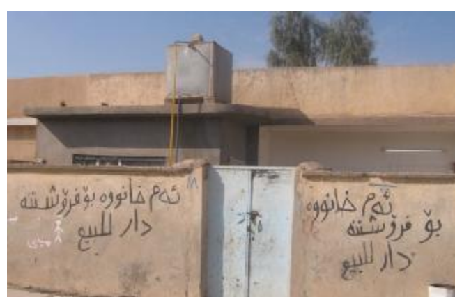
خانويك لە مەخمور تابلوى فرۆشتنى ھەلئاسىو (دەنگى مەخمور)

دەبوايە لەھەرتەمەو سوودمەند بوايە، لەبىر ئەو مەن ھەستدەكەم كە خەرىكە بلىم لەھەردوولا بىبەش بوو، ياخود بەشكى كەمى لەخەمەتگوزارىيەكان بەرگەوتو و "بەپىت ئەو زانبارىيانەى رۇژنامەى (دەنگى مەخمور) رۇژانە بەدەيان مال ئەو ناچەيە چۆل دەكەن و روودەكەنە شارى ھەولتەو دەروپەرى، ھەرچەندە تائىستا دەزگە فەرمىيەكانى قەزاي مەخمور ھىچ داتايەكى دروستىيان نەخستتە روو سەبارتە بەئەمەرى ئەو مال و خىزانانەى كۆچيان كوردو، بەلام وەكو ئەو ئەندام پەرلەمانتارە رابىدەگەيەنیت كەوا زياتر لە ۷۰۰ مال سەنورىەكەيان چۆل كوردو، ئەمەش ئامازەيەكى خرابە بۆ ناچەيەكى دابراوى وەكو مەخمور، چونكە كۆچ كۆن خەرىكە دەبىتە دياردەو رۇشنىتى ھەر مالئەك زەحمەتە جارىكى دىكە ئەو خەلگە بگەرتتەو شويىنى خۆى لەبەر ئەو مەخمور بەخراپترىن باروئوخدايەو پىويستى بەچارەسەرى بە پەلە ھەبە.