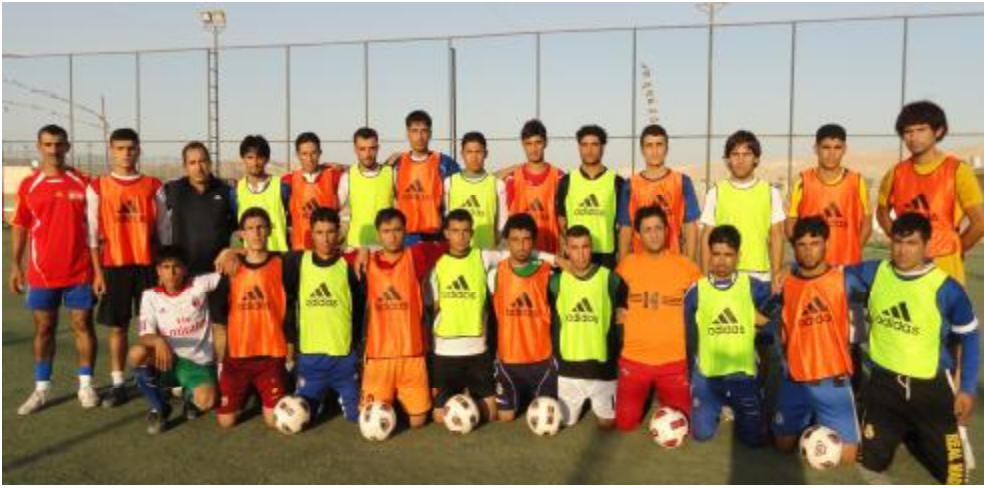
"داواکارین لە بەرپرسیاری دەقەری مەخمور کە هاوکارییەکانیان تەنیا مەعەنەوی نەبێت"

دەکەین بە شێوەیەکی باشتر لەسالی پار لەبەر ئەوەی خولی پلە یەکی ئاستی بەهێز و یاریزانی بەتوانای تێدا، بۆیە لە هەولێر ئەوەداین کە یاریزانی دیکە بهێتین بۆ ریزی یانە کەمان."