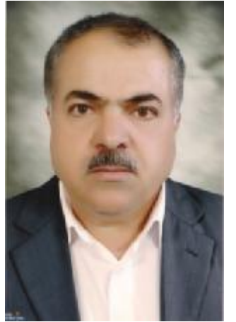
د سهردار نه‌حمه‌د گهردی