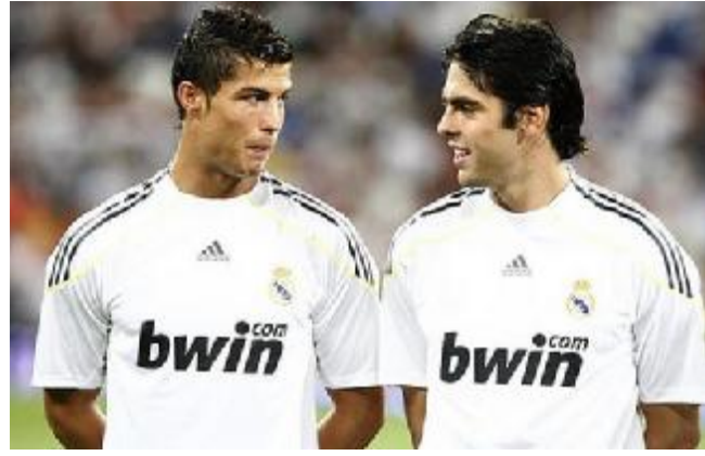
کەشخەیی رۆنالدۆن وەک ئامۆش لایکی چینی دەیهوێت بە پیتی توانای سەرجهەم هەلسۆکەوتەکانی رۆنالدۆن شتیوازی جلۆبەرگ لە بەرکەردنەکانی

کریستیانۆ رۆنالدۆی پرتوگالی بوو تە جیگە سەرئەنجامی پیاوان و کاکاش بە پێچەوانە و بوو تە جیگە سەرئەنجامی خانمان. رۆنالدۆی ئاسی ئیسپانی بلۆیکردووە، لەدوای گەشتنی شاندی تێپی تۆپی پیتی یانەی ریاڵ مەدرید بە چینی و ئامادەبوونی هاندەرئەنجامی ئیجگار ژۆر ئەوەی نیشاندان ئەو یانە یە خاوەنی هەواداریکی ژۆرە لە ئیوێشاندان رۆنالدۆ کاکا لە هاریکەکانیان زیاتر هەواداریان هەیە. لە چینی ئیستا ژۆرئەنجامی پیاوان عاشقی شتیوازی جلۆبەرگ و ریک پۆشی و