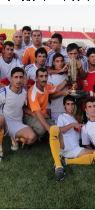
دیمه‌نیك له‌کاتی ناهه‌نگ گه‌یڕانی یاریزانانی یانه‌ی مه‌خموور

یاری هه‌ولێ گۆل تۆمارکردنی دوای یاریزان‌ه‌کانیان له‌ناو یاریگا باشت‌ر ده‌بینران و چه‌ندین هه‌رشه‌یان کرده‌سه‌ر یانه‌ی رکا به‌ر، به‌لام له‌هه‌رشه‌یه‌کی پێچه‌وانه‌وه‌ له‌خوله‌کی به‌لێدانی سه‌ر گۆلێکی جوانی بۆ یانه‌ی مه‌خموور تۆمارکردو دوای دوو خوله‌ک تیبی مه‌خموور گۆلی دووه‌می تۆمارکرد له‌یاریگای یاریزان (ئه‌یاد مه‌ته‌ر)، یارییه‌که‌یان بۆ به‌رزه‌وه‌ندی خۆیان کۆنترۆل کرد، دوای له‌خوله‌کی (۲۹) گۆلی سه‌ییه‌میان له‌یاریگای یاریزان (هه‌ندریزه‌سول) تۆمارکرد، له‌دوایدا تیبی مه‌خموور چه‌ندین هه‌رشه‌ی مه‌ترسیان کرده‌سه‌ر گۆلی تیبی هه‌له‌بجیه‌، تا له‌خوله‌کی (۴۴) یاریزان (هه‌وشمه‌ند جه‌لال) تسانی گۆلی یه‌که‌م بۆ تیبی هه‌له‌بجیه‌ تۆمار بکات و تایی یه‌که‌م به‌نه‌جامی (۳-۱) گۆل ته‌واوو، پاشان له‌تایی دووه‌می یاری یاریزانی هه‌له‌بجیه‌ شه‌هید بالاده‌ستی خۆیان له‌یاریگای نواندو بۆ تۆمارکردنی گۆل و گۆپی نه‌جامه‌که‌و چه‌ندین هه‌رشه‌ی مه‌ترسیان کرده‌سه‌ر گۆلی یانه‌ی