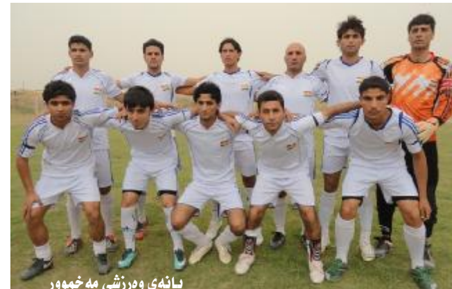
یانه‌ی وه‌رزشی مه‌خموور

پێشکه‌وت، یانه‌ی مه‌خموور له‌سه‌ر ده‌ستی ئه‌و راهینه‌ره‌ تسانی چوار گۆل تۆمار بکات. هیوای سه‌رکه‌وتن بۆ راهینه‌ر بۆزار ئه‌کره‌م ده‌خوازین.