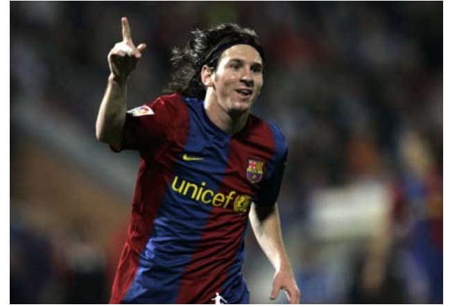
سەرۆکی یانە ئەنتەر دەپھە ویت بۆندیک ئەگەل میسی مۆریکات (مەسیمی مۆراتی) رایگە یانە کەوا ھەول دەدات بۆند ئەگەل یاریزانی ھەلبژاردە