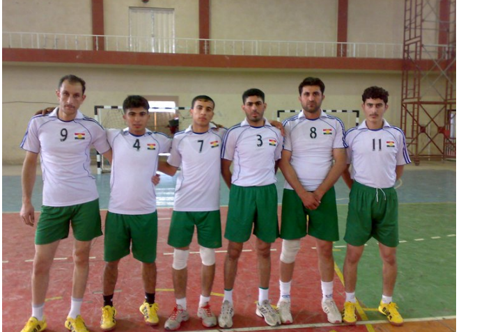
عوسمان بەرپۆشەرى ناوھەندى وەرزش و لاوانى مەخمور سەبارەت بەچۆنەیتى خۆم ئامادەكردنى ناوھەندەكەیان گوتى "بەھۆى دواكەوتنى خولەكە كە دەكەوتتە ناو دەوامى فەرمى قوتابیان كە ئەمەش كارگەرە دەبیت بۆ سەر یاریزانەكان كە ھەندىكیان ناتوانن ئامادەبن لەكاتى بەرپۆشەوونى یارییەكان"، گوتیشى "ھەربۆیە تێپەكان بەشپۆشەكى مام ناوھەندى خۆیان ئامادەكردوو بۆ ئەم خولانە، بەلام ئەوێ تابیەت بێت بە بنگەكەمان لەيارى توپى دەستدا بەشپۆشەكى باش خۆى ئامادەكردوو".