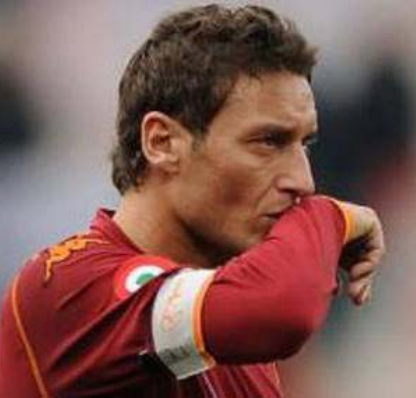
(فرانسيسكو توتى) یاریزانى ھەلبژاردەى ئیتالیا و یانەى رۆمى ئیتالی خەلاتى پێسى زېرىن بەدەستھینا. یاریزانى ھەلبژاردەى ئیتالیا و یانەى رۆمى ئیتالی (فرانسيسكو توتى) تەمەن (۲۴) سال خەلاتى پێسى زېرىن لەلایەن یانە پالەوانى جیھانى لە مۆناکۆ بۆ سالی (۲۰۱۰) بەدەست

ھینا. شایەنى گوتنە خەلاتى زېرىن لەلایەن یانەى پالەوانى جیھانى دەبە خشریت بەو یاریزانەى كە سەرووی (۲۹) سالیە، و یاریزانى ئیتالی سەرکەوت بەسەر ھەریەك لە یاریزانان (نێفید بیکام،