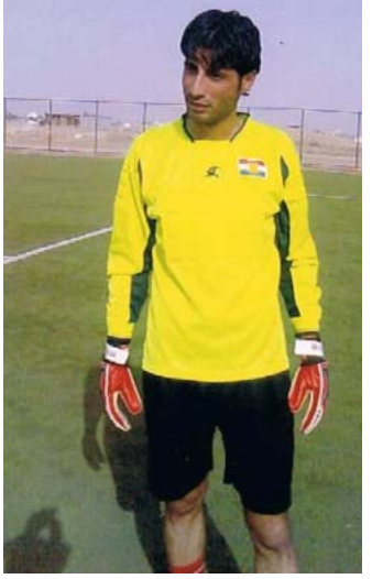
پیدانى پیدوایستى یارى و خواردن و ئۆتۆمبیل بۆیان، لێرەو دەپرسم من بەرپرسیارم لەو ئەجامانە یان ئێوێ دەستەى كارگێرى؟ ھەموو لایەك باش دەزانن ماوھەك بەر لەو یارییە باوكى من