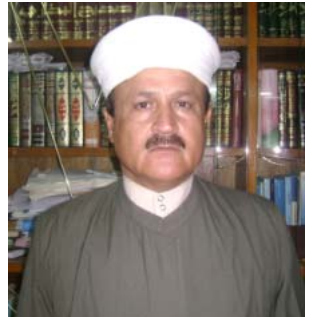
مه لا محه مه د محيدين:

پيويسته حكومت له مانگى رهمه زان نرخ له سه ركه لو په له كان دابنيت