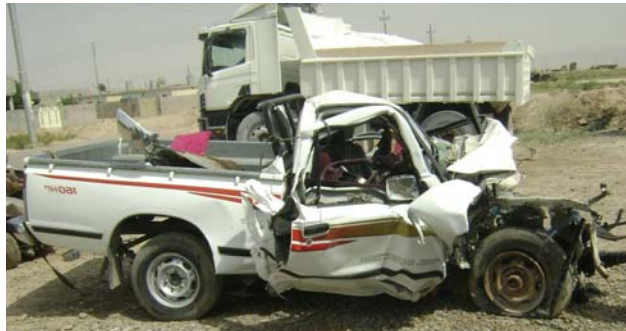
دوو كوپو باوكيك له و رووداوه دا بوونه قوربانى

پيكدادانه سى سه ر نشينى نيسانه كه گيانان له ده ستدا، كه دوو كوپو باوكيك بوون، شويفرى سكانيكه ش له رووداوه سه لامهت ده رجووه دواى رووداوه كه شويفرى ئۆتومبيلى جۆرى سكانيا، خۆيان به يه كدا كيشاو له نه جمائى ئه و