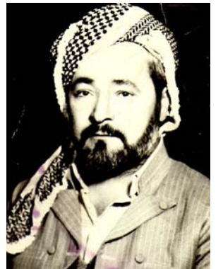
ته ممووز، مانگی کوچی