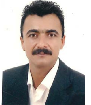
هه ژار شه وقی:

به لگه میژووییه کان دهریده خات موسل شاریکی