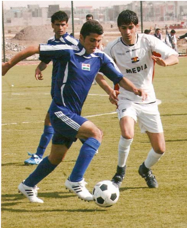
هیوادارم یانه که مان به شرداری پله ی نیایی کوردستان و ئیراق بکات

وهرزشوانان به باشترین یاریزان ناوت ده بهن له مه خمور تۆچی ده لیبیت؟