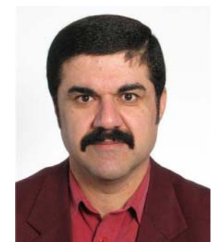
دهرسیم دیبه گه یی

کوردی له سه ره خاکی کوردستان دروستکرا، به بۆ چوونی من هه موو کاتیک گونجاوه بۆ داوا کردنه وه ی " لهقی هه قه یه یقینه که له لایه ره (۴) بخۆینه وه.