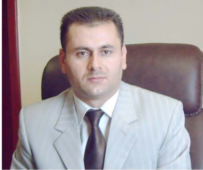
بازران سهید کاکه

دابهشی سه سه هاوولاتیانی نه دهقهره ی دهکهن " ههروهه نامازه ی بهههه " ئیمه پیمان وایه نهو قهره بوو کردنهوه ی مه خموور " ۱۴۰ دهستکهوتیکه گهروهه بۆ خهلهکی مه خموور، چونکه لهو قهره بوو کردنهوه یه ۲۰ ههزار خیزان سوودمه ند دهبن، به سهروای نهو ریزه یهکی باشه و داها تیکه باشه بۆ ناوچه که و جوولانهوه ی بازار، بۆیه دهست خۆشی لهو کارمه ندانه دهکهن که کارهکانی نهو مادهیه بهریوه دهبن."