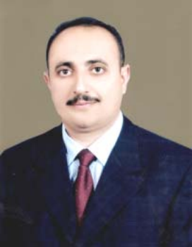
غه فوور مه خمووری

رۆژنامه سه رۆئیکسی کسارا ده بینن له پرۆسه یه وشیه یار کردنه وو فۆلکردنه وه ی بنسه ماکانی دیوکر اسسیت و ئسازادی به سه روو و گه یاندنی راستیه کان له هه م کۆمه لگایه کسداو، په یامی هه م رۆژنامه یه کیش پیویسته بیلا یه نی بیه یی و راستگویی و گه یاندنی دهنگه جیا و زه کان بیت، له هه مووشی گرنگتر به سویری و هه سه قگویی خسائیکی جهوه ره یه بۆ په یدا کردنی خۆینه ر بۆ رۆژنامه که.